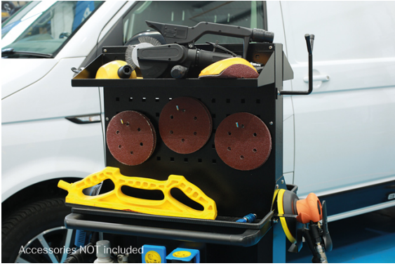
Accessories NOT included